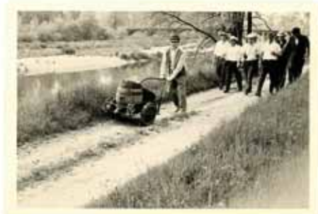
Die Bilder brauchen wohl Acinsons Kommentar mehr, sie sprechen für sich.