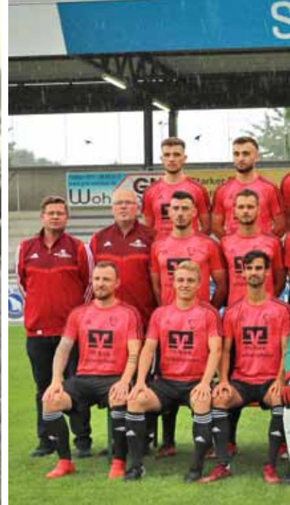
Die Erste Mannschaft des VfB Hallbergmoos – damals und heute