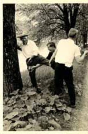
Juni 1963 Freundschaftsspiele

VfB. Hallbergmoos I - FC Berglern I. 4:2