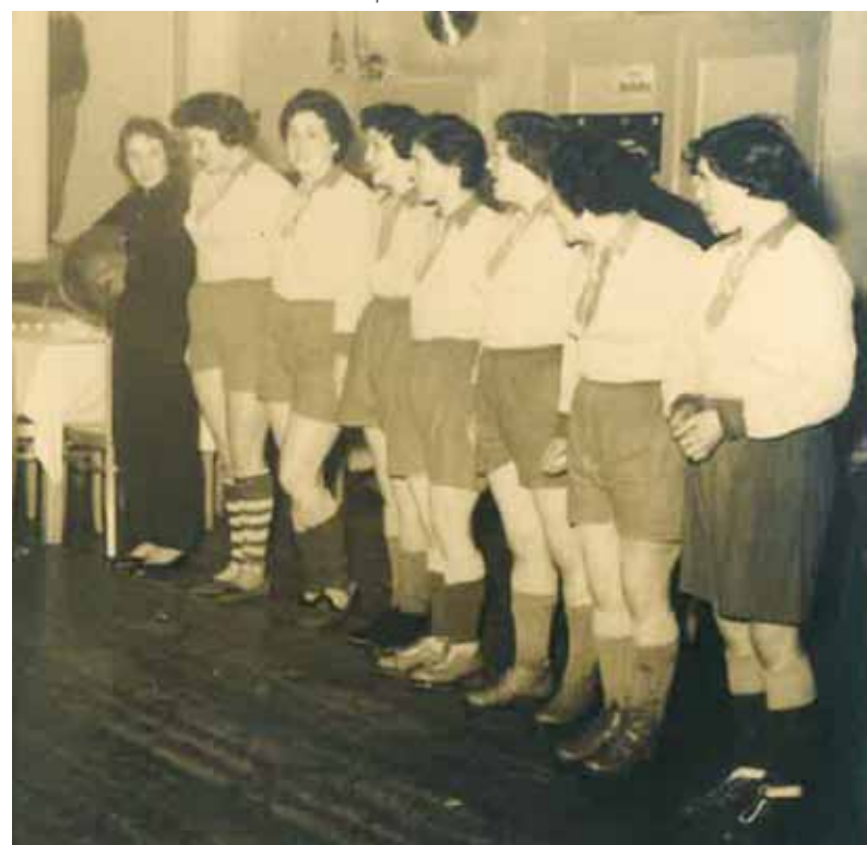
Die Damenmannschaft 1958 beim Sportlerball