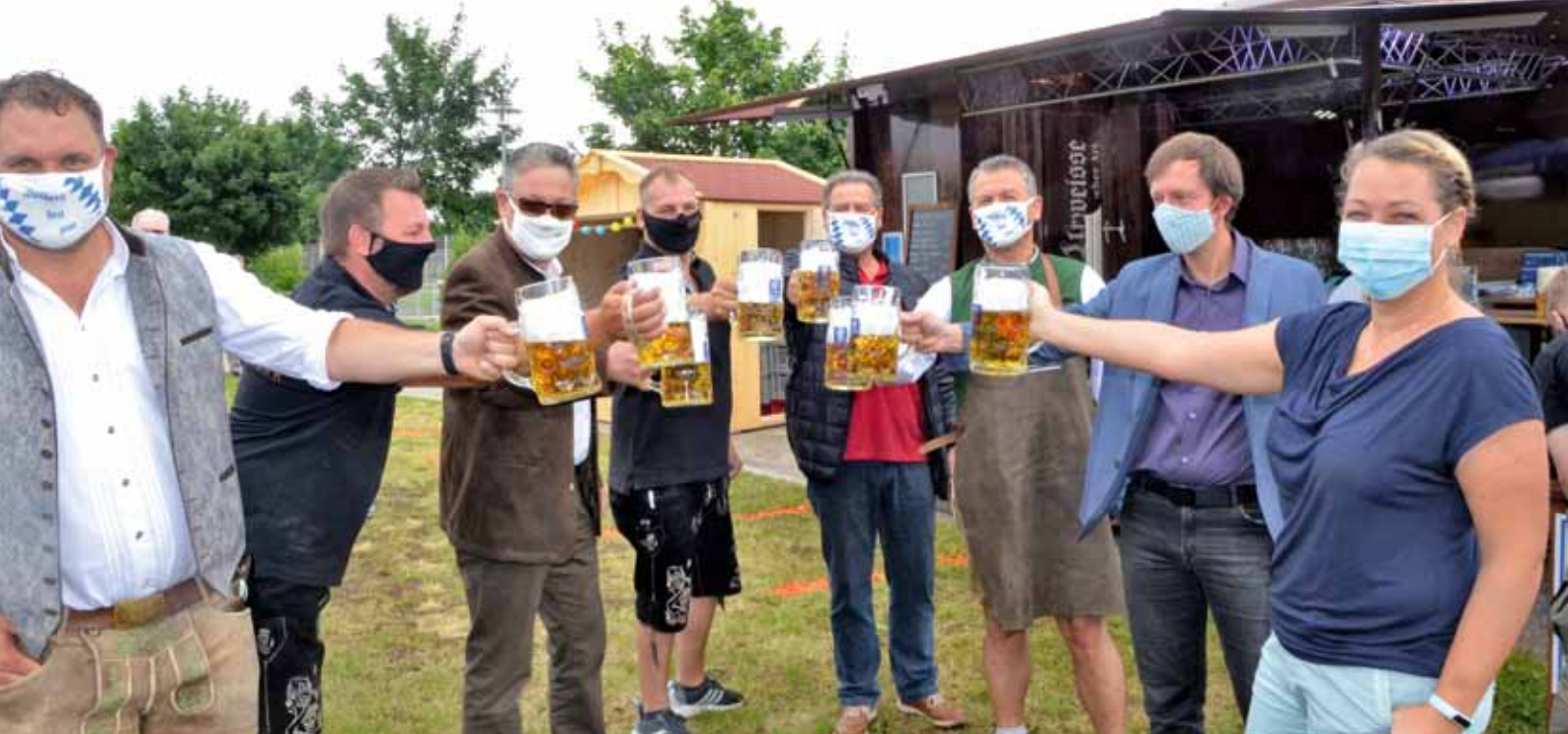
Geschützt durch Masken und mit Abstand wurde kurz nach dem Fassanstich zum ersten Mal auf dem VfB-Biergarten angestoßen.