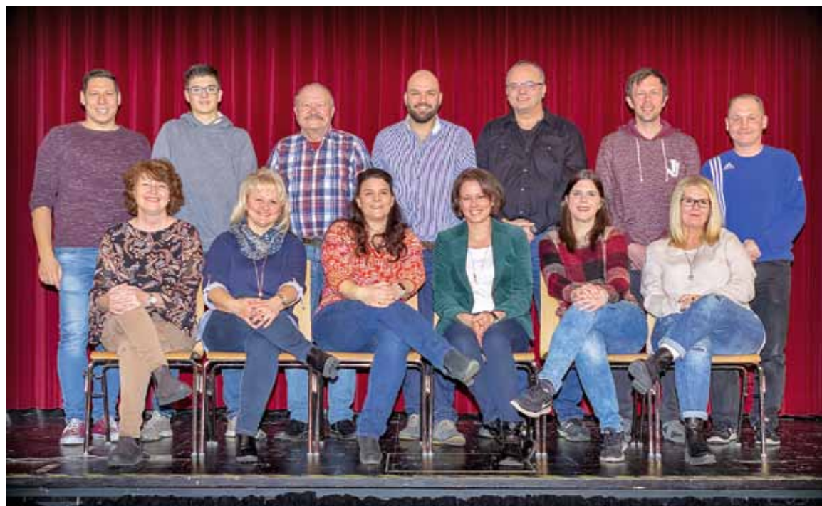
Das Team der Moosbühne spendet trotz des coronabedingten Ausfalls in diesem Jahr eine schöne Summe an den guten Zweck.