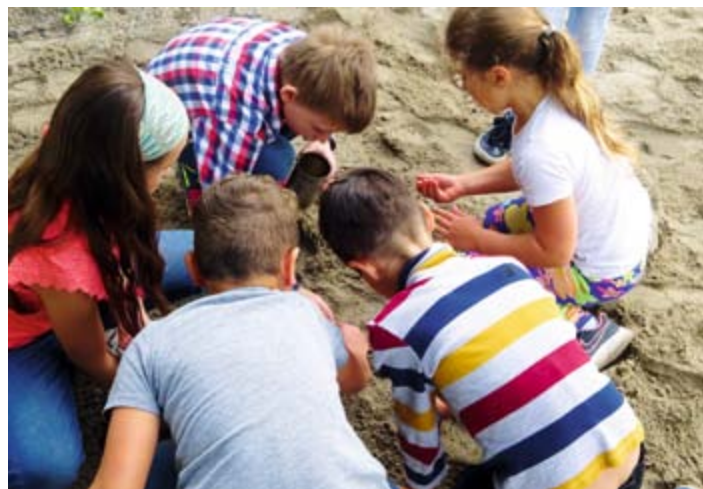
„Goldrausch“ im Ecksteinhaus - die Kinder waren begeistert auf der Suche

Eifrig wurde geschaufelt, sehr sorgfältig gesiebt und so konnten bald erste Erfolge erzielt werden. Jeder Fund sorgte für riesige Begeisterungstürme bei den Goldgräbern und wurde gut bewacht. Einige Kids waren sogar auf eine richtige Goldader gestoßen und fanden so viele Nuggets, dass sie gerne mit weniger erfolgreichen Gräbern teilten. Den ganzen Nachmittag „schürften“ die Hortkinder mit viel Spaß in der Grube und holten unzählige Goldstücke aus dem Sand. Ihren Schatz trugen sie selbstverständlich mit großem Stolz nach Hause. Alle waren sich einig: Das war eine tolle Aufregung im Ecksteinhaus!