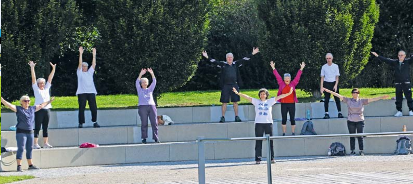
Endlich wieder gemeinsam sporteln - bei schönem Herbstwetter gern im Freien