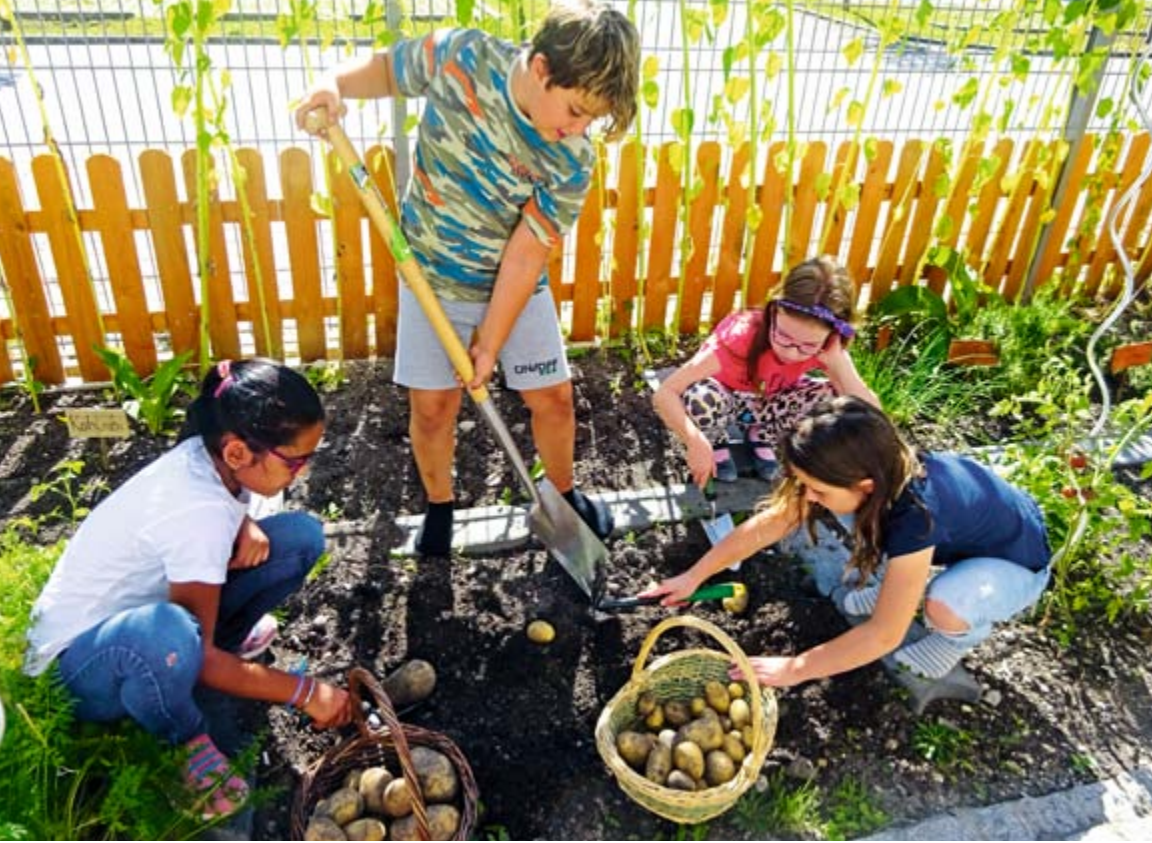
Kartoffeln aus dem Schulgarten konnten die Ecksteinkinder kürzlich ernten