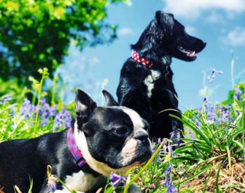
Auslauf ohne Leine und Spielen mit Gleichgesinnten im gesicherten Bereich, davon profitieren alle – Hund, Besitzer und auch alle Nichtbesitzer.