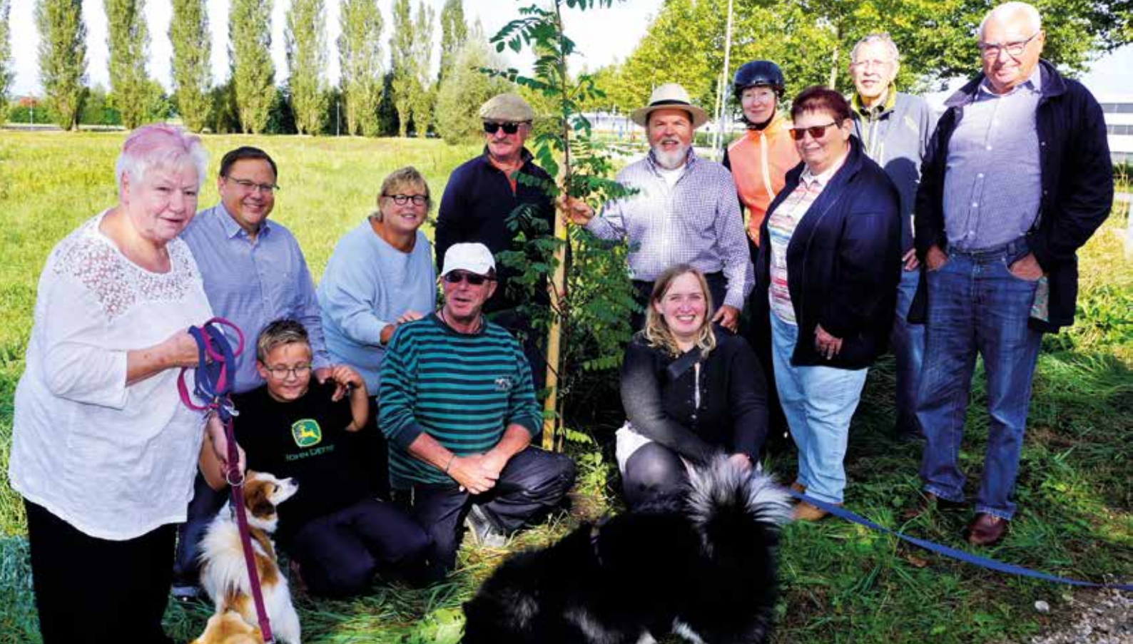
Tradition bei der SPD: Jedes Jahr einen Baum pflanzen