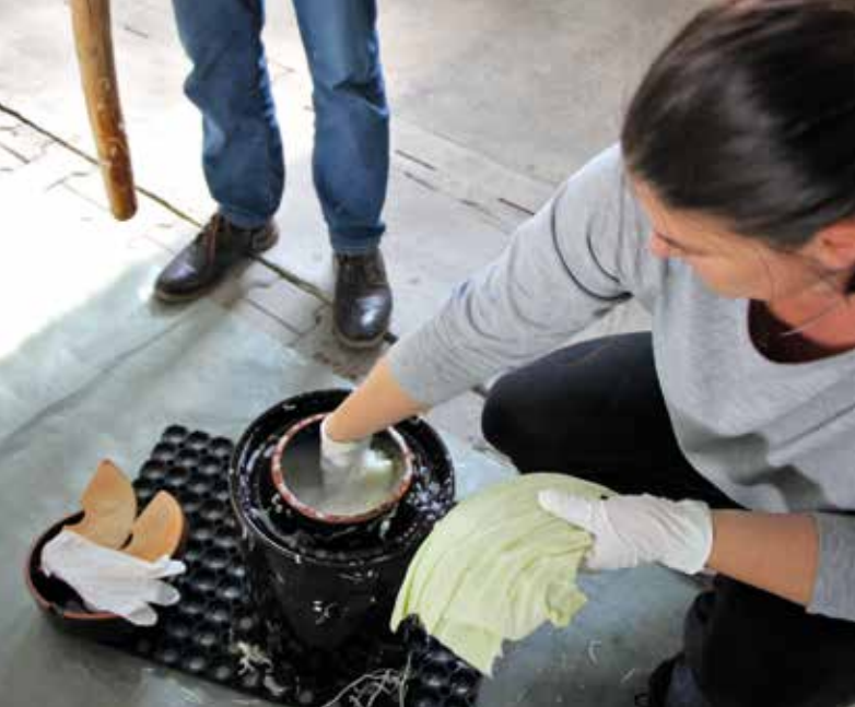
Das weich gestampfte Kraut wird mit einem sauberen Krautblatt bedeckt