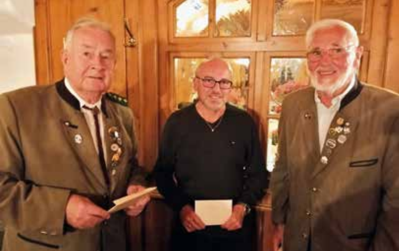
Die Gewinner des Preisschießens