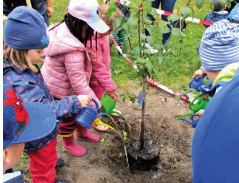
Die kleinen Gartenfreunde des Wolkenschlösschens freuen sich über ihren neuen Zwetschgenbaum