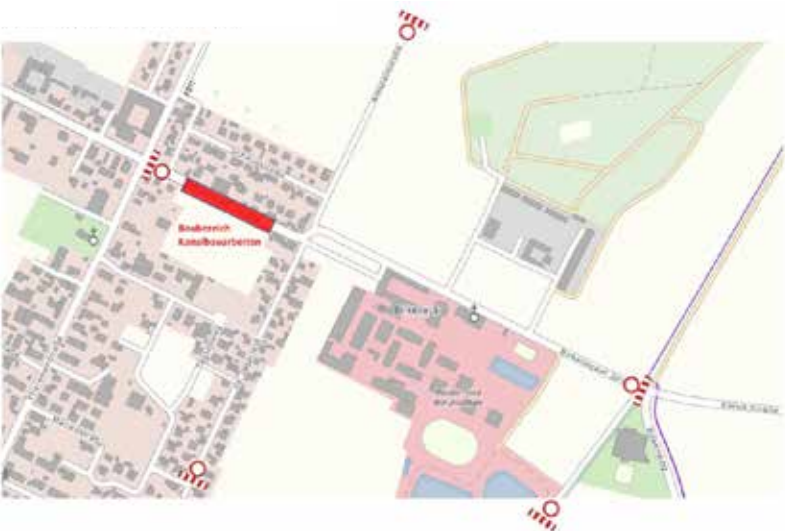
Vollsperrung Birkenecker Straße (Anlieger bis Baustelle frei)

Wir bitten Sie um Verständnis für die Baumaßnahme und die damit verbundenen Unannehmlichkeiten.