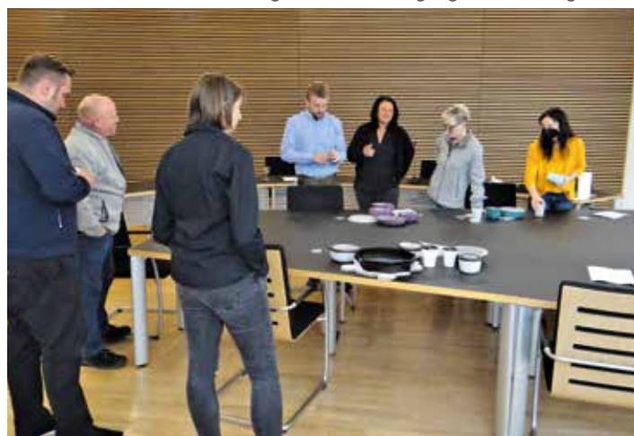
Teilnehmer der Infoveranstaltung bei der Besichtigung der Mehrwegmuster