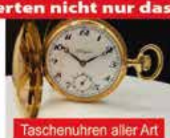
Taschenuhren aller Art