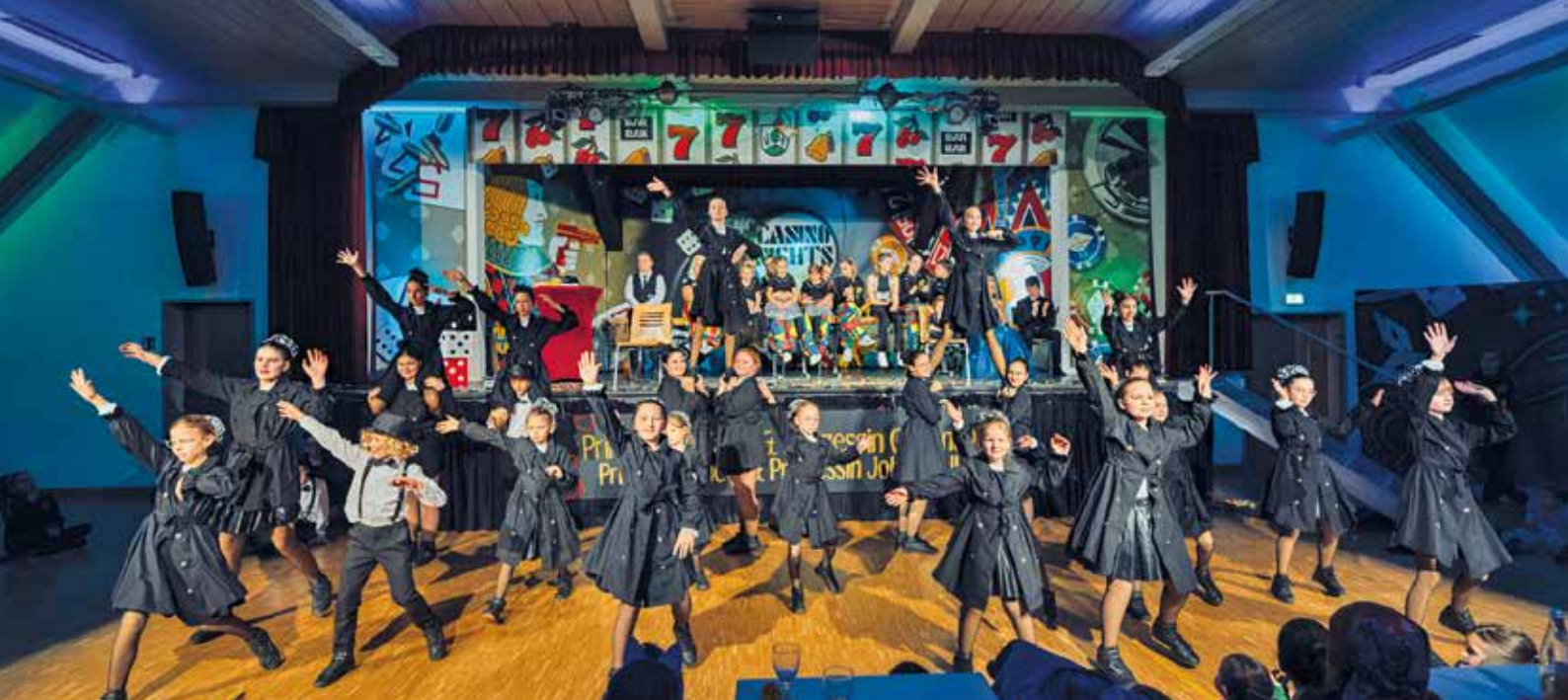
Beeindruckender Auftritt: Die Kindergarde begeistert mit ihrer Tanzdarbietung und erntet viel Applaus von den jungen Besucherinnen und Besuchern.