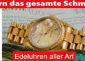
Edeluhren aller Art