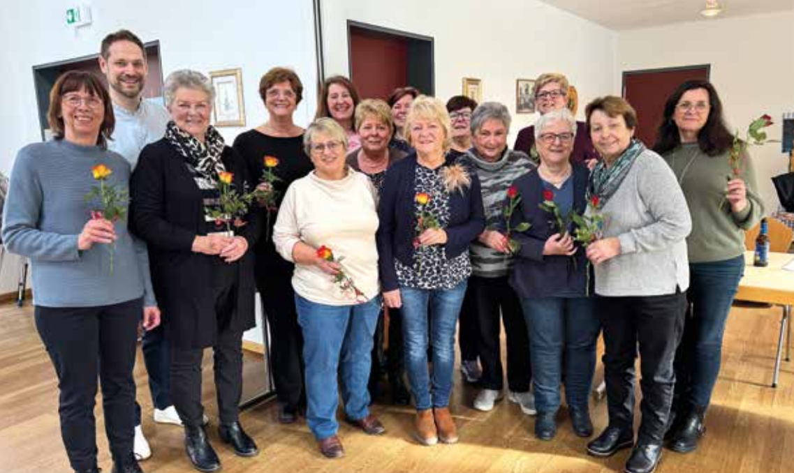
Die neu gewählte und bisherige Vorstandschaft der Frauen St. Theresia mit Bürgermeister Benjamin Henn.