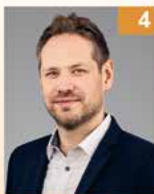
Benjamin Henn I. Bürgermeister