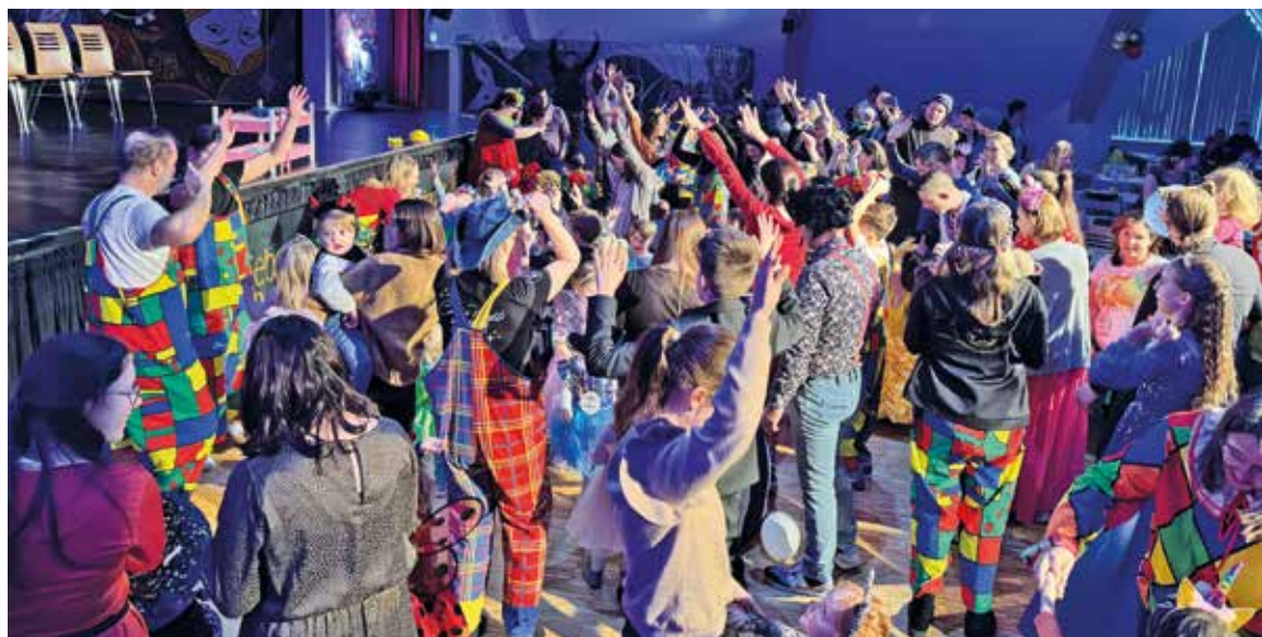
Viele kleine und große Faschingsfans tanzten beim zweiten Kleinkinderfasching der Narrhalla Hallbergmoos/Goldach bereits am frühen Vormittag gemeinsam im Saal.

Für Sie berichtete Kate Eigner.