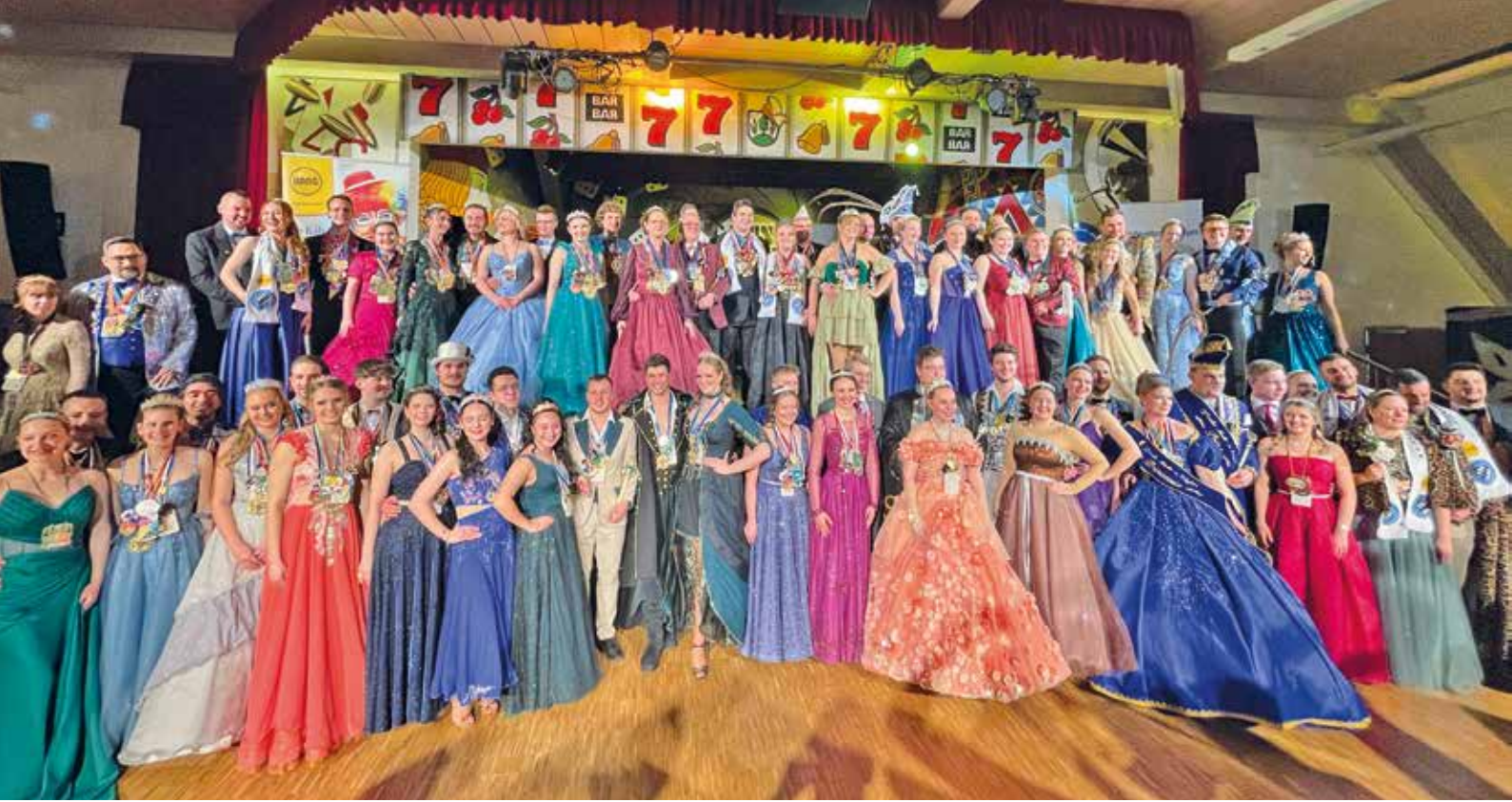
BDK-Prinzenpaartreffen erstmals in Hallbergmoos – 41 Prinzenpaare feiern gemeinsam unter dem Motto „Casino Nights“