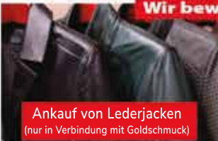
Ankauf von Lederjacken (nur in Verbindung mit Goldschmuck)

Wir bewerten nicht nur das Gold, sondern das gesamte Schmuckstück!