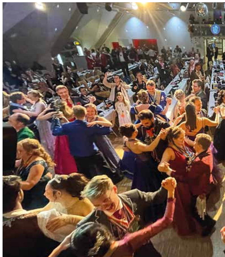
41 Prinzenpaare und Walzer: „Gemeinsamer Abschluss: Die Prinzenpaare tanzten zum Ende des offiziellen Programms gemeinsam einen Walzer.“

gramms gestaltete die Große Garde der Narrhalla Hallbergmoos-Goldach mit ihrem Thema „Casino Nights“. Eleganz und Dynamik bestimmten den Auftritt, der von lan-