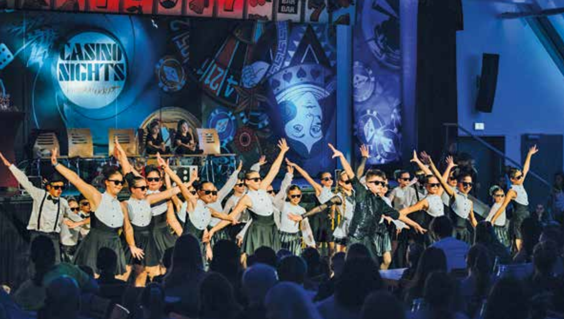
Starker Auftritt beim Kinder- & Teenie-Gardetreff: Die Kindergarde der Narrhalla Hallbergmoos-Goldach begeisterte mit ihrer Show und sicherte sich einen hervorragenden 3. Platz