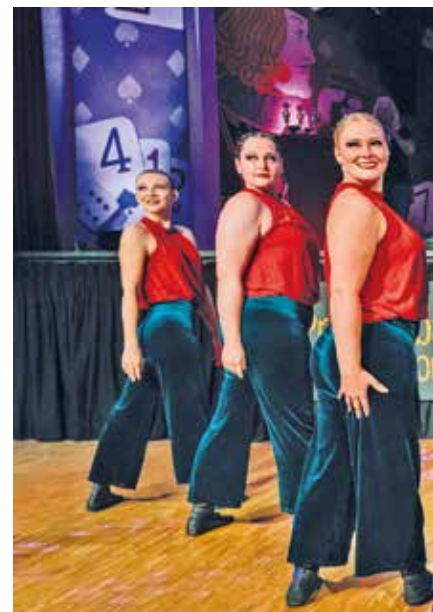
Gemeinsam stark: Die Garde der Narrhalla Freude am Tanz und monatelanges Training

Auf der Bühne standen Marschgarden, Prinzenpaare, Showtanzgruppen und Männerbal-