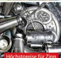
Höchstpreise für Zinn