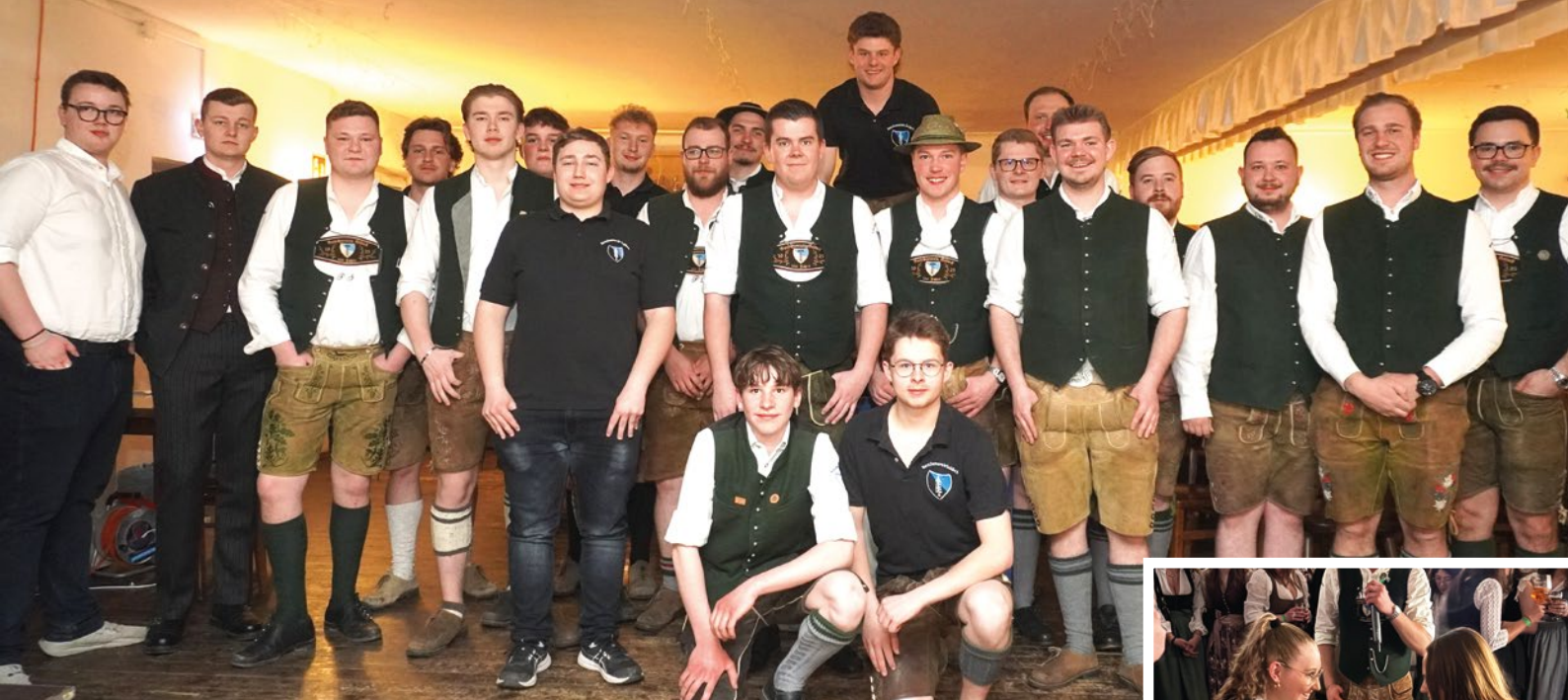
Burschenverein Goldach gewohnt souverän: Auch unter neuer Führung gelingt's!