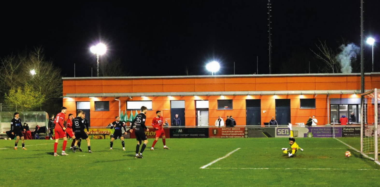
Arian Kurmehaj (nicht im Bild) trifft mit einem sehenswerten Weitschuss den Anschlusstreffer gegen Kastl