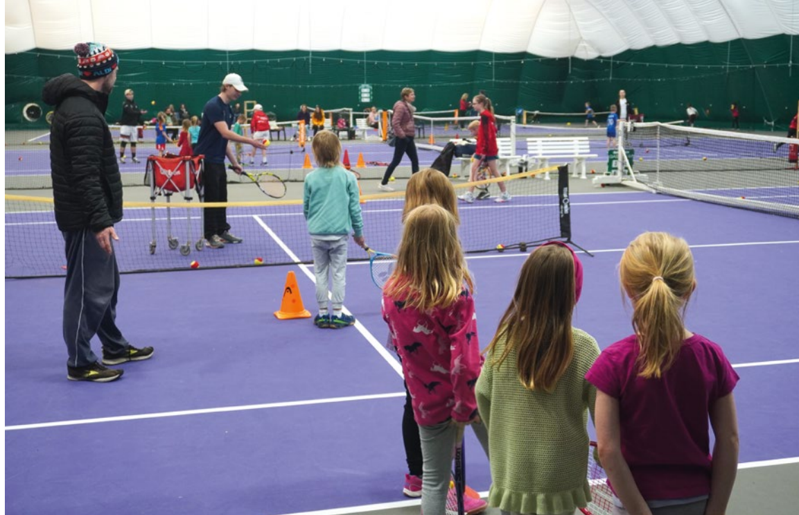
Bum-Bum-BOOM: Großer Andrang beim Schnuppertag der Tennisabteilung.