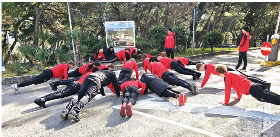
U17 Trainingslager – keine Urlaubsfahrt, sondern der Grundstein für die Saison

Situationen und gemeinsamen Erlebnissen führte zu einer spürbaren Weiterentwicklung, sowohl in sportlicher Hinsicht als auch im mannschaftlichen Gefüge. Damit wurden wichtige Grundlagen geschaffen, um gut vorbereitet und mit gestärktem Selbstverständnis in die bevorstehende Rückrunde zu starten. ■