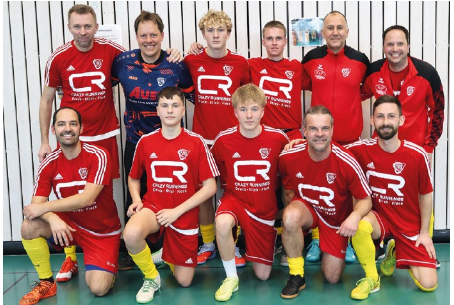
3. Platz bei der inoffiziellen Hallbergmooser Hallenfußball-Gemeindemeisterschaft

Am Samstag, den 28. Februar 2026, nahmen die Jugendtrainer am 11. K&F-Cup teil. Dies ist die inoffizielle Hallenfußball-Gemeindemeisterschaft in Hallbergmoos. Ziel war es, als Mannschaft ein geschlossenes und überzeugendes Auftreten zu zeigen sowie die Platzierung aus dem Vorjahr zu verbessern. Der Start ins Turnier gelang mit einem 3:0-Erfolg gegen die VfB-AH. Im darauffolgenden Spiel gegen das Team Hangover, dem späteren Turniersieger, musste eine 0:3-Niederlage hingenommen werden. In der dritten Begegnung entwickelte sich ein intensives und umkämpftes Spiel gegen die Ringer vom SV Siegfried, das mit einem 3:2-Sieg entschieden werden konnte. Auch das letzte Vorrundenspiel gegen die